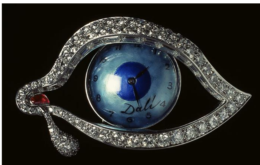
2. Брошь «Глаз времени». Сальвадор Дали, Карлос Алемани. 1949

Сравните украшения, представленные в задании. Для этого кратко сформулируйте сходства и различия в 7–10 предложениях. Обратите внимание на форму, цвет, линии, сочетание материалов, на названия украшений.