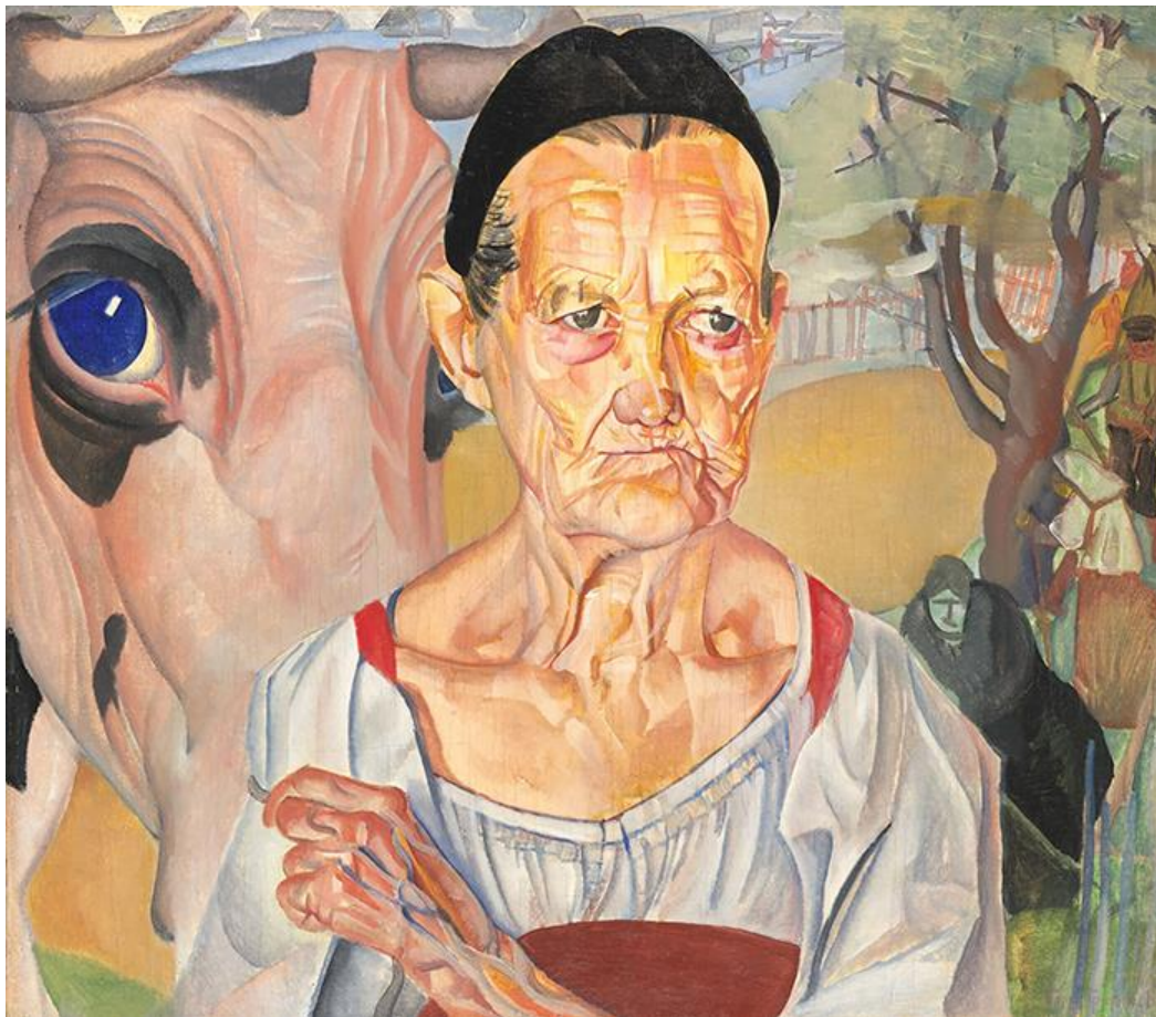
2. Б. Григорьев. Старуха-молочница. 1917 – нач. 1920-х гг.

Посмотрите на представленные работы и подумайте об их сходствах и различиях.