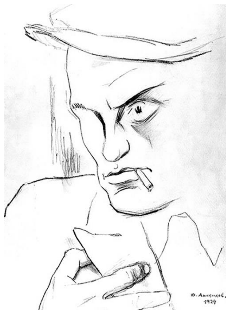
Юрий Анненков. Портрет Владимира Маяковского (1924)