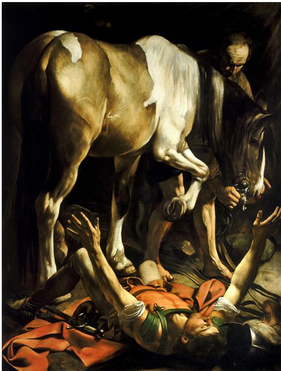
Микеланджело да Караваджо. Обращение Савла. 1601.

Внимательно посмотрите на картину Караваджо.