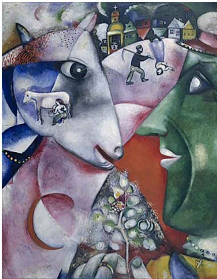
1. М. Шагал. Я и деревня. 1911

Работа «Старуха-молочница» входит в цикл «Расея», созданный Григорьевым в 1917 – начале 1920-х годов. Этот цикл писался художником в разгар страшных событий в истории страны – гражданской войны и революции. Григорьев работал над ним в Санкт-Петербургской и Олонецкой губерниях, где сохранился не только патриархальный уклад жизни, но и острая связь с другим периодом гражданской смуты – временем церковного раскола, поскольку в эти места был сослан протопоп Аввакум.