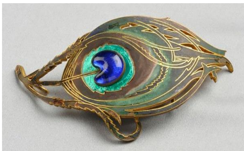
1. Пряжка «Павлиний глаз». Пиль Фререс. Начало XX века

В задании представлены два ювелирных изделия, выполненные в форме глаза. Пряжка «Павлиний глаз» сделана в начале XX века в стиле модерн французским мастером Пилем Фрересом. Он использовал для своей вещи достаточно дешёвые материалы: полихромную эмаль, синее стекло и позолоченный металл. Брошь «Глаз времени» исполнена ювелиром Карлосом Алемани в 1949 году по эскизам Сальвадора Дали. Знаменитый художник реализовал себя и в области декоративно-прикладного искусства – по его эскизам выполнено в общей сложности 37 ювелирных изделий. Для этой брошки были выбраны очень дорогие материалы – платина, бриллианты и рубин, только глазное яблоко выполнено в синей эмали.